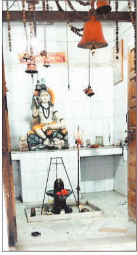
शिव मंदिर जहां घटना हुई।